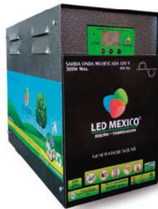
Para Baterías Litio Ion Inversor ILM