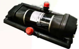
1 Bomba 26 L/min