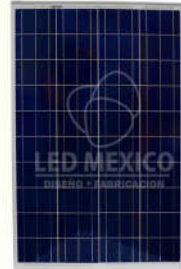
2 Paneles Solares 100 W