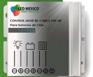
Controlador CL-20A Tecnología MPPT