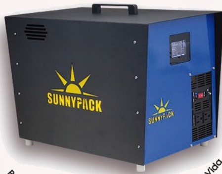
Para Baterías Litio Ion Inversor ILMP