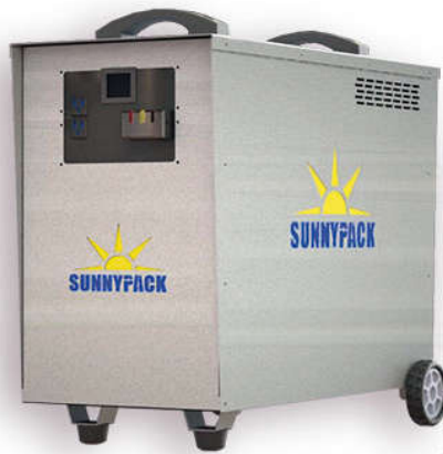
Para Baterías Litio Ion Inversor LMP