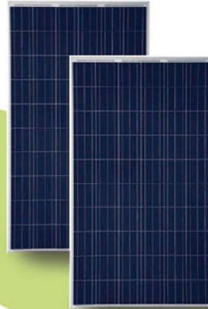
Paneles PERC HALF CELL (Opcional)